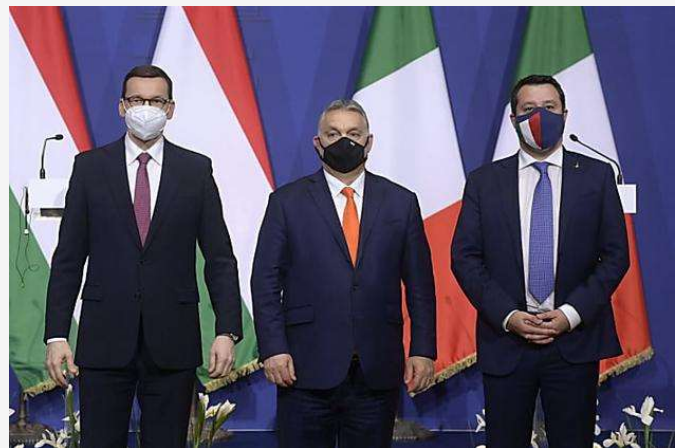
L'obiettivo è Roma, non Bruxelles